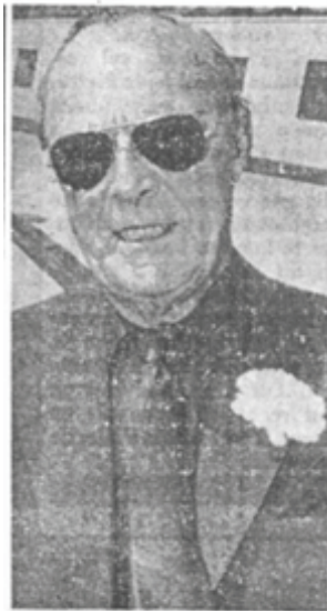
■ PRINS BERNHARD ...Generaal van Oranje...