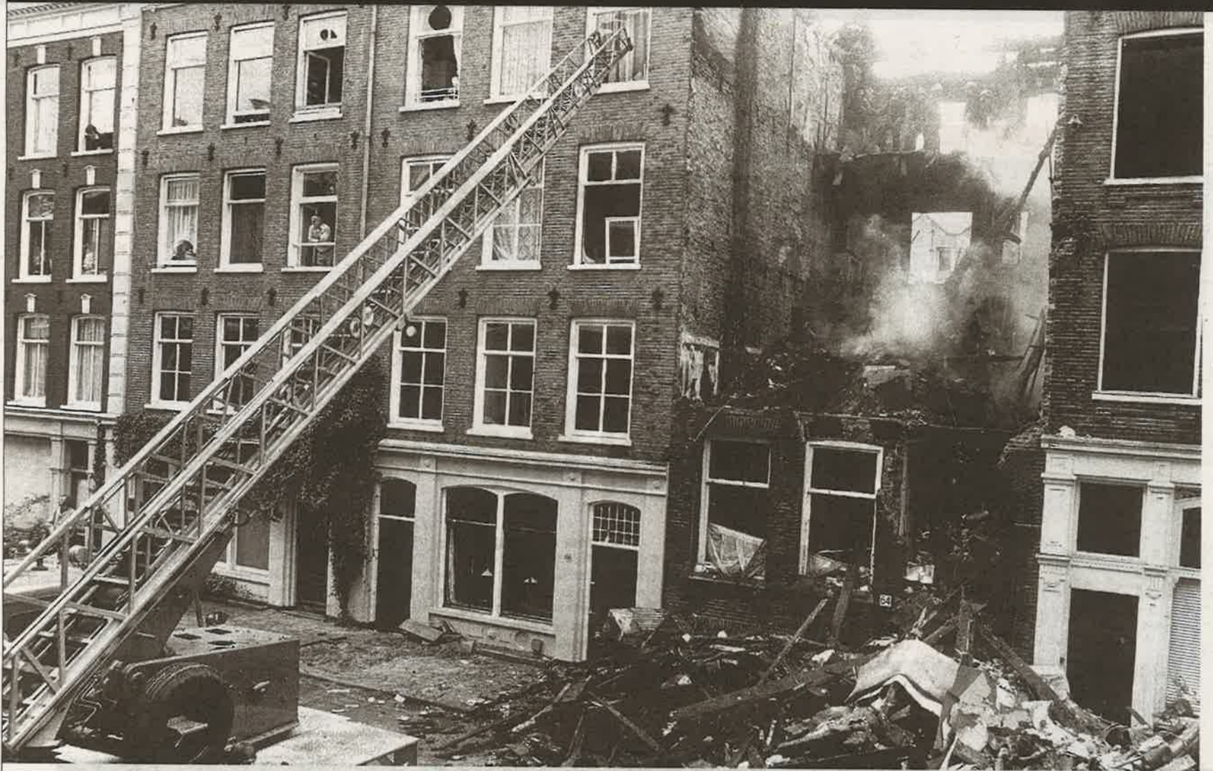
Op 16 juni 1980 wordt het pand Quellijnstraat 64 in Amsterdam totaal verwoest.