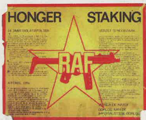
Affiche, gedrukt door het Rood Verzetfront.

van een pand aan de overkant een oliera- dator wordt teruggevonden die door de explo- sie uit het pand is geslingerd. Elders vindt de politie een stuk staal dat zich door een raam in een kast heeft geboord.