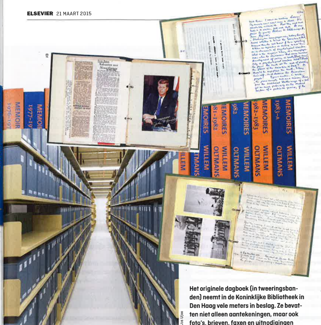
Het originele dagboek (in tweeringsbanden) neemt in de Koninklijke Bibliotheek in Den Haag vele meters in beslag. Ze bevatten niet alleen aantekeningen, maar ook foto's, brieven, faxen en uitnodigingen