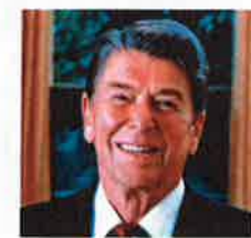
Oltmans was geen fan van Ronald Reagan

Als minister van Buitenlandse Zaken verklaarde Ben Bot (77) in 2005 bij de viering van de 60-jarige onafhankelijkheid van Indonesië dat Nederland met zijn politieke acties in Nederlands-Indië (1947-1949) 'aan de verkeerde kant van de geschiedenis' was komen te staan.