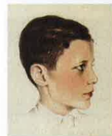
Getekend toen hij 12 was, Cap Martin Hotel

'Ze zijn gek geworden in Den Haag' telt 157 pagina's, kost € 14,95 en is onder meer te bestellen op www.elsevier.nl/oltmans , of bel 0314-358350.